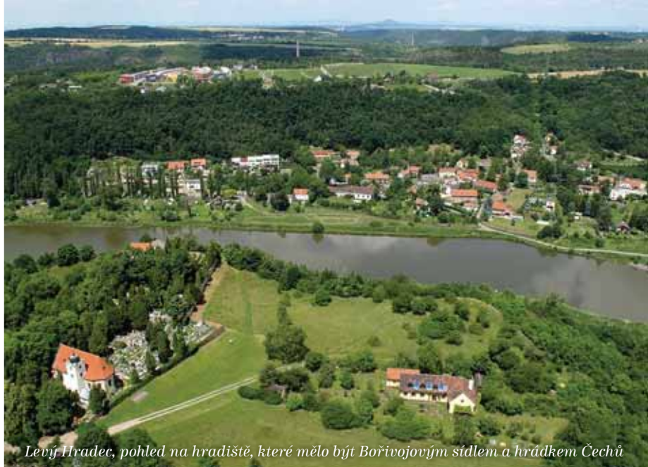
Levý Hradec, pohled na hradiště, které mělo být Bořivojovým sídlem a hrádkem Čechů

o knížeti Bořivojovi pochází ze svatováclavských legend psaných ve druhé polovině 10. století. Bořivoj by měl být dědečkem svatého Václava, neboť Bořivojovi a kněžně Ludmile se připisují synové Spytihněv a Vratislav, kde starší Spytihněv skončil bez potomků (uvádí se r. 915) a po mladším Vratislavovi (uvádí se r. 921) usedl na knížecí stolec Václav. Historická genealogie tzv. Přemyslovců by tak měla počínat Bořivojem, prvním pokřtěným knížetem Čechů. Na rozdíl od historiků však církev shledává Václavův původ spíše u mučednice Ludmily, báby sv. Václava, nikoliv po mužské