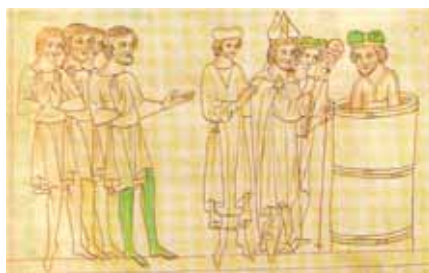
Křest Bořivojův na středověkém vyobrazení

linii u knížete Bořivoje. Přitom dle tradice oba, jak Bořivoj, tak svatá Ludmila, přijali křest z rukou biskupa Metoděje (nutno dodat, že v případě svatě Ludmily se nejedná ani o legendistický záznam, ale o tradiční podání). Kolem Bořivoje panují vůbec spíše rozpaky než informace, které bychom mohli považovat za hodnověrné. Nejvíce se dozvídáme z pera benediktýnského mnicha Břevnovského kláštera Kristiána, jenž se hlásí do nejbližšího příbuzenstva knížete Boleslava. Latinsky psaný text sám autor datuje do doby služby biskupa Vojtěcha, tedy mezi léta 982–997. Přestože, stáří tzv. Kristiánovy legendy není zcela jednoznačné a může jít také o zdařilou fikci nebo úpravu ze století třináctého, přikloňme se k současným trendům, že původní text i autor pocházejí skutečně z konce 10. století. Pak by Kristián byl potomkem Bořivoje a dělily by je pouze tři až čtyři generace v knížecí linii. Paměť čtyř generací je zcela