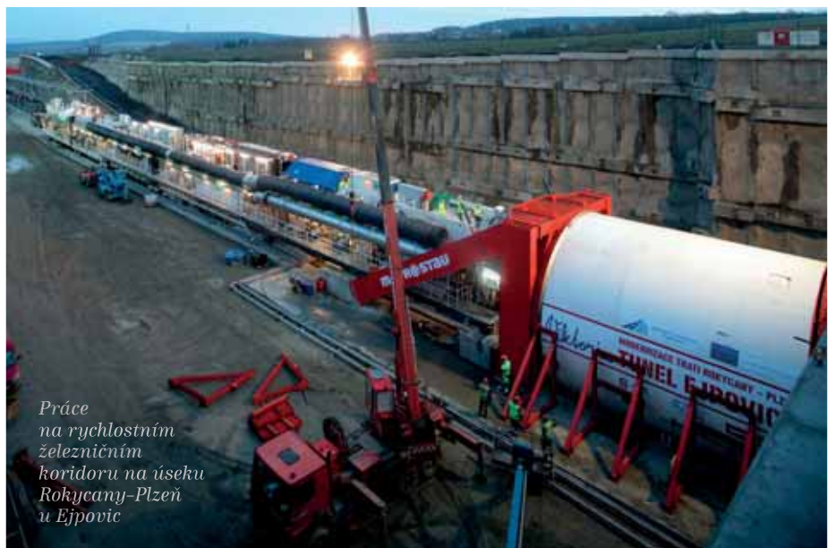
Práce na rychlostním železničním koridoru na úseku Rokycany–Plzeň u Ejpovic

Zemí věčného ohně je i Ázerbájdžán, ale ne kvůli vulkanické činnosti, ale díky obrovským zásobám ropy a zemního plynu. 27. května 2015 jsem se zúčastnil