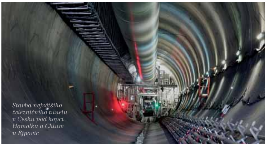
Stavba největšího železničního tunelu v Česku pod kopci Homolka a Chlum u Ejpovic

realizovat železniční projekty. Dosud nejrůznější je na rychlostním železničním koridoru na úseku Rokycany-Plzeň, kde u Ejpovic pod kopci Homolka a Chlum stavíme největší železniční tunel v Česku. Modernizace železniční tratě je součástí naplňování koncepce interoperability transevropských dopravních sítí, o níž rozhodla Evropská komise. Tunel o průměru deset metrů provádíme razicím štítem s přítlakem. Délka dvou jednokolejných tunelů od východního portálu k západnímu bude 4 150 metrů a trať Praha-Plzeň se díky tomu zkrátí asi o 6,1 kilometru.